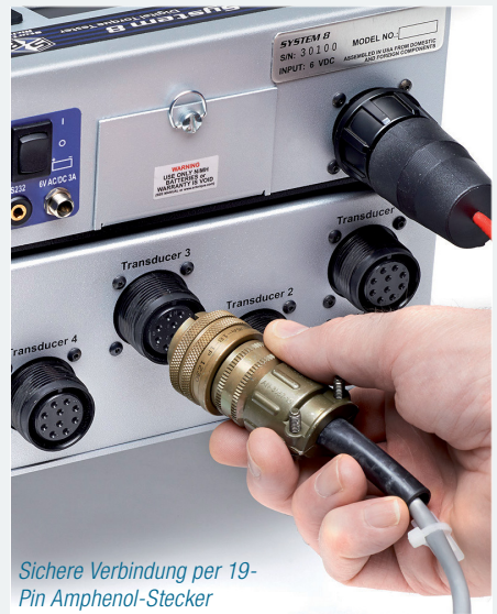
Sichere Verbindung per 19-Pin Amphenol-Stecker