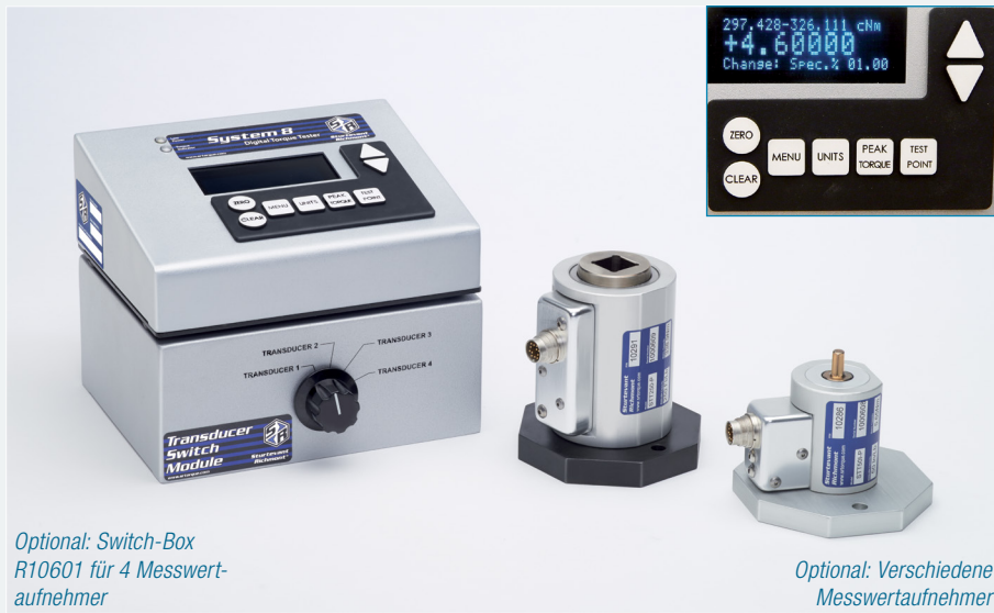
Optional: Switch-Box R10601 für 4 Messwert-aufnehmer