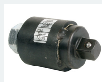
Optional: Schraubsimulatoren (RDF) bis 340 Nm