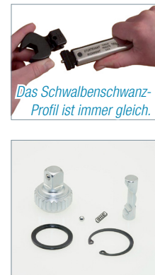
Das Schwalbenschwanz-Profil ist immer gleich.