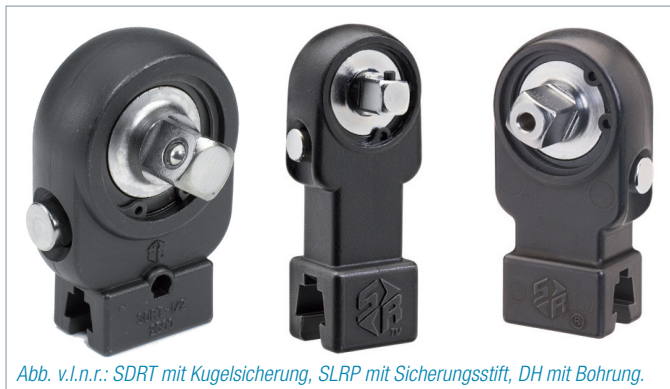
Abb. v.l.n.r.: SDRT mit Kugelsicherung, SLRP mit Sicherungsstift, DH mit Bohrung.