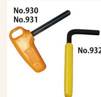
Option: Einstellwerkzeug #931 für BCSP10N-20N #930 für BCSP40N-300N #314 für BCSP400N

Nur das Modell BCSP400N verfügt über einen Metallgriff ('MH') mit gerändelter Oberfläche, die übrigen Modelle haben einen ergonomisch geformten Kunststoff-Handgriff ('BK').