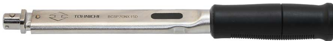
Zahlreiche Köpfe zur Auswahl (Größe je nach Typ/Modell).