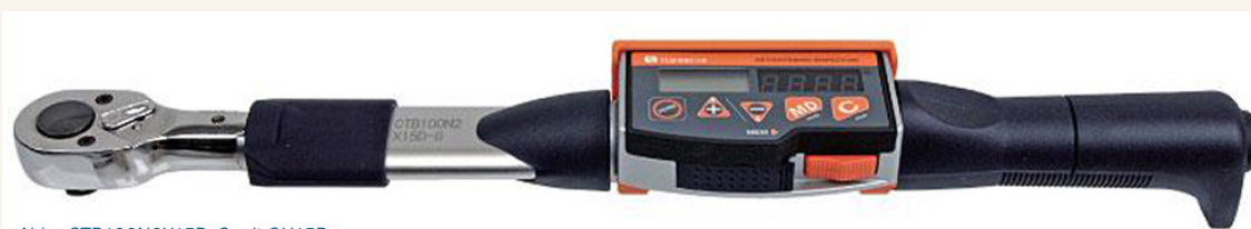
Abb.: CTB100N2X15D-G mit QH15D