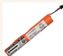
Inkl.: Akkupack BP-5