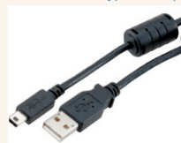
Option: PC-Kabel 2m zur Datenübertragung.