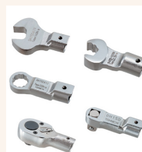
Option: Zahlreiche Köpfe zur Auswahl (Größe je nach Typ/Modell).