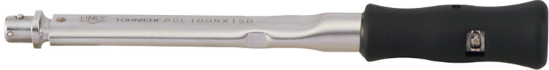
Zahlreiche Köpfe zur Auswahl (Größe je nach Typ/Modell).