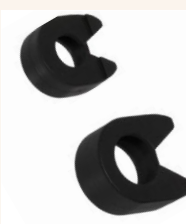
Option: Schutzkappe für den Ratschenkopf.

Sobald das eingestellte Drehmoment erreicht ist, signalisiert ein deutlich vernehmbares Klickgeräusch durch den internen Kippmechanismus den Abschluss des Anziehvorgangs.