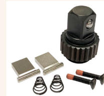
Option: Ratschen-Reparatursatz (je nach Typ/Modell).