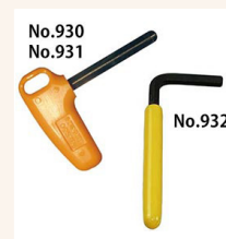
Option: Einstellwerkzeug #931 für QSP25N; #930 für QSP50N-140N.