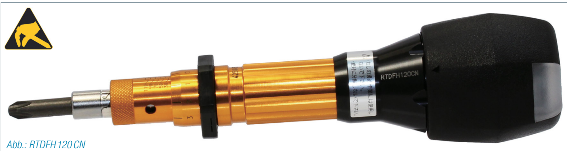
Abb.: RTDFH 120 CN