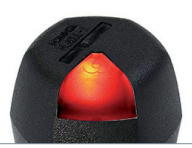
Abb.: Setting-Box SB-FH2

Falls Drehmoment NG, wird dies durch rote LED angezeigt.