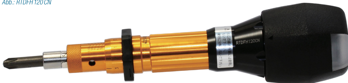
Abb.: RTDFH 120 CN

Wenn Anzugsmoment OK, wird dies durch blaue LED angezeigt.