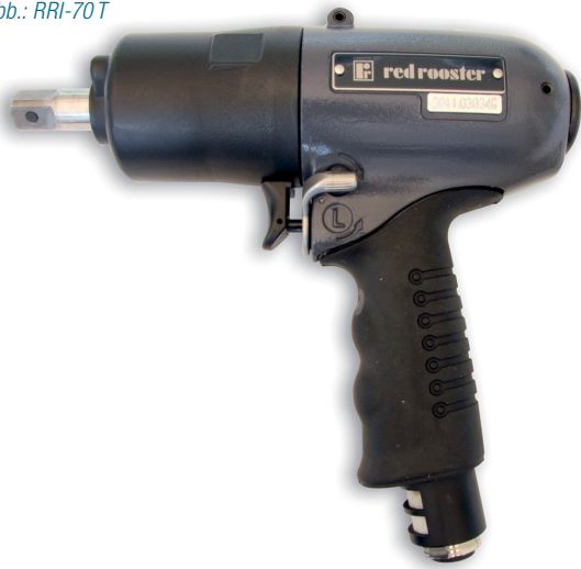
Abb.: RRI-70 T