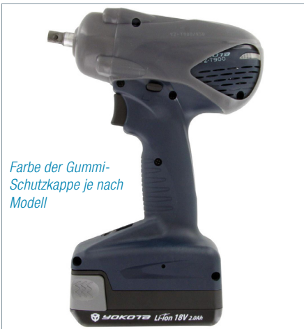
Farbe der Gummischutzkappe je nach Modell