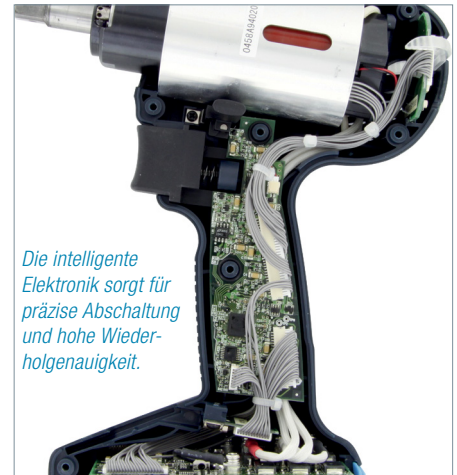
Die intelligente Elektronik sorgt für präzise Abschaltung und hohe Wiederholgenauigkeit.